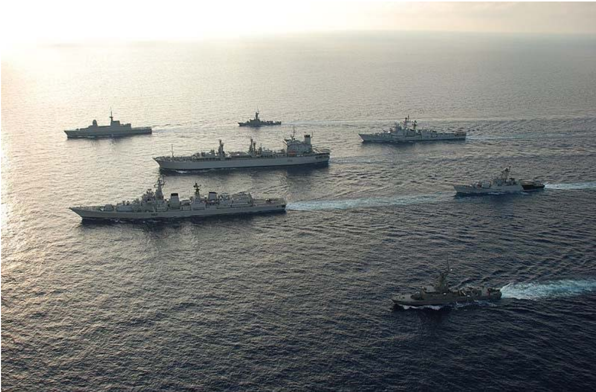
Simbex 2009 : l'ensemble des navires participants