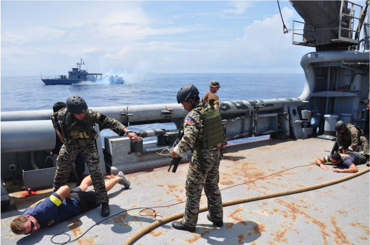
Force spéciales de la Marine philippine s'entraînant à l'interpellation de suspects en mer avec la Marine U.S.