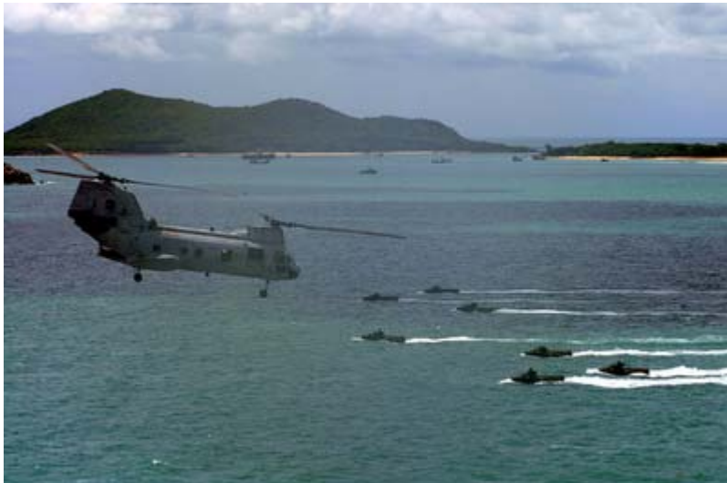
Exercice Cobra Gold 2010, simulation de débarquement.

D'autres exercices sont centrés sur la lutte anti sous-marine, sur le déploiement d'une force dans le cadre d'une opération de secours ou de guerre alors que certains exercices se limitent à des patrouilles communes. L'ensemble du spectre des activités des forces navales est donc embrassé par ces exercices en Asie du Sud-est.