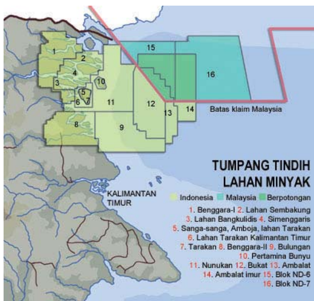
Carte des revendications territoriales à Ambalat, indiquant les différentes concessions.

Cette question de l'anxiété stratégique est d'autant plus prégnante que de nombreuses tensions territoriales émaillent le paysage géopolitique de l'Asie du Sud-est. Outre le cas des Spratlys, très largement documenté, nous pouvons nous intéresser à Ambalat. Cette région Indonésienne, située sur l'île de Kalimantan (Bornéo) est en partie revendiquée par la Malaisie. Plus exactement, c'est une zone considérée comme faisant partie des eaux territoriales indonésiennes qui attire la convoitise de Kuala Lumpur. Dès 1999, les deux Etats attribuèrent des concessions à différentes compagnies pétrolières, n'arrivant pourtant pas à s'entendre de façon définitive sur les limitations spatiales de ces dernières. Les conséquences sont sans appel : des incidents permanents entre les deux marines de guerre. Toutefois, un pas a été franchi cette année, avec au mois de juin 2009, la riposte armée de la marine Indonésienne, ouvrant le feu sur un patrouilleur malaisien.